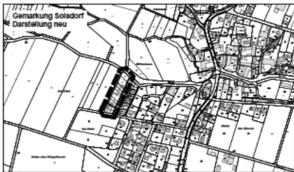
Abbildungen genordet, ohne Maßstab